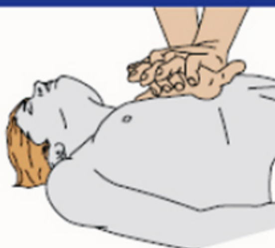
Stlačenie hrudníka 30x : Vdychy 2x