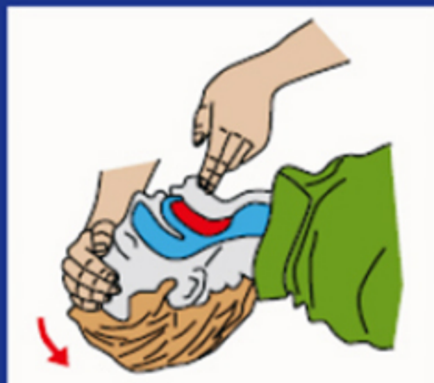
Uvoľni dýchacie cesty